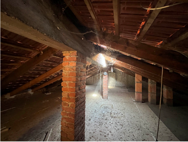
Via Cardinale Guglielmo Massaia